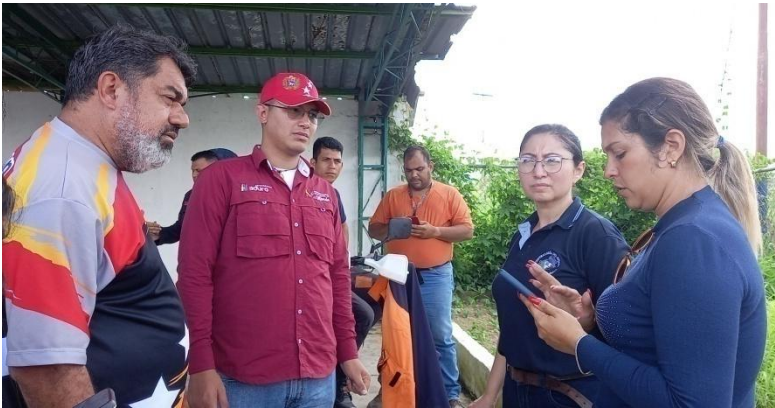
Acompañamiento en la entrega de insumos médicos a los afectados por las lluvias en los municipios Tulio Febres Cordero y Caracciolo Parra y Olmedo.