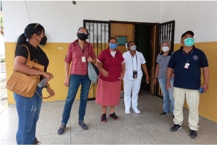
Trabajo de recuperación del Centro de Diagnóstico Integral (CDI), municipio Obispo Ramos de Lora.