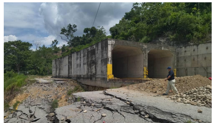
Trabajos de recuperación de los túneles.