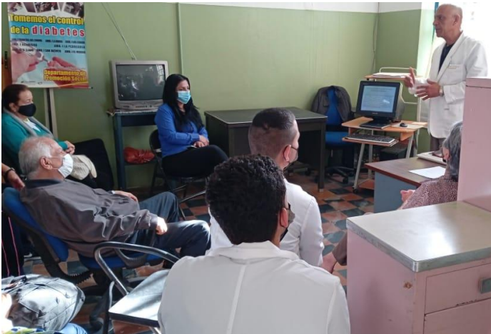
Verificación del programa Club de Diabéticos del Ambulatorio El Llano, municipio Libertador