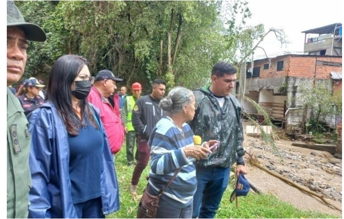
Verificación de los daños ocasionados por las lluvias en la parroquia Lasso La Vega, municipio Libertador.