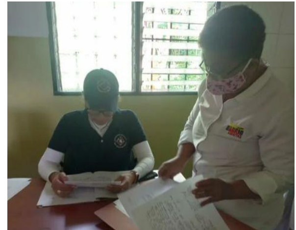
En atención a denuncia, verificación de la ejecución del Proyecto "Equipamiento y acondicionamiento con equipos médicos al consultorio popular Barrio Adentro La Vega", municipio Campo Elías.