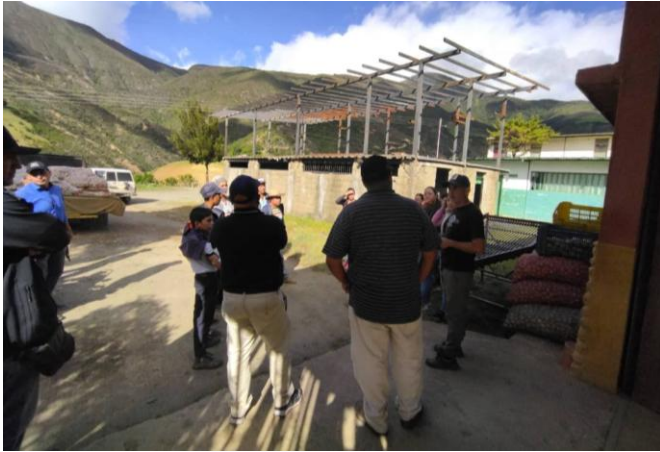
Ambulatorio rural, escuelas, liceo, así como el puente que comunica las aldeas de San Antonio y San Pablo, municipio Sucre.