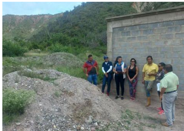
Petición relacionada con el retiro de escombros de la Comunidad Mucumbú Bajo, municipio Sucre.