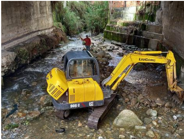
Verificación de trabajos de reparación de calzada en el Puente La Milagrosa, ubicado sobre la quebrada Milla, municipio Libertador.