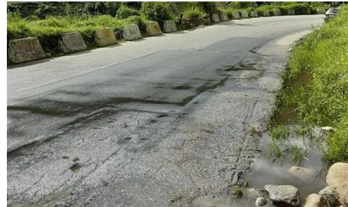
En atención a denuncia, verificación de la Obra "Rehabilitación de la Troncal 001, vía trasandina del municipio Rangel del estado Bolivariano de Mérida.