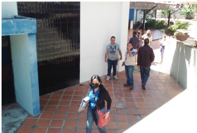
En atención a denuncia, verificación de la infraestructura de la Dirección de Salud Ambiental del estado.