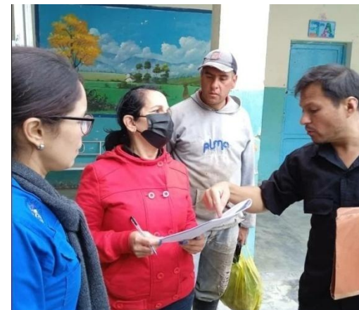
En atención a denuncia, verificación de la obra ejecutada en el Grupo Escolar Tomás Zerpa, municipio Rangel.