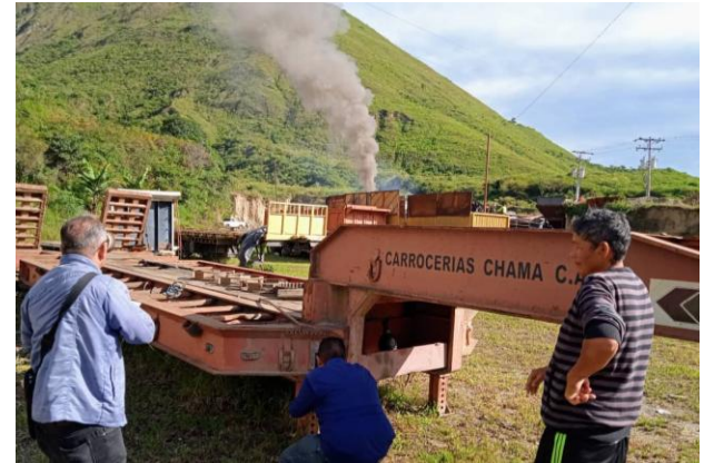
Planta de Asfalto ubicada en Bailadores, municipio Rivas Dávila.