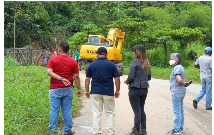
Reparación puente Quebrada de La Virgen, municipio Alberto Adriani, afectado por las lluvias.