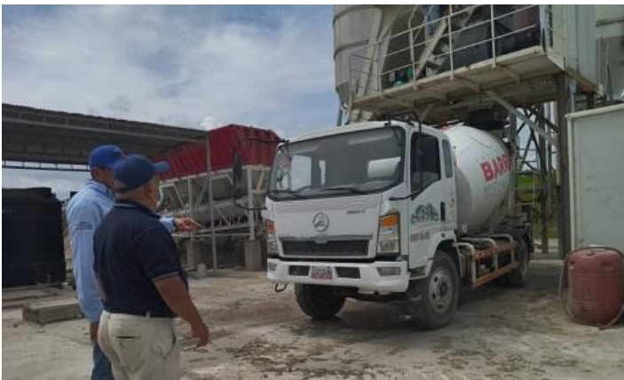
Planta de asfalto y planta de cemento Puente Chama II, ubicada en el municipio Alberto Adriani.